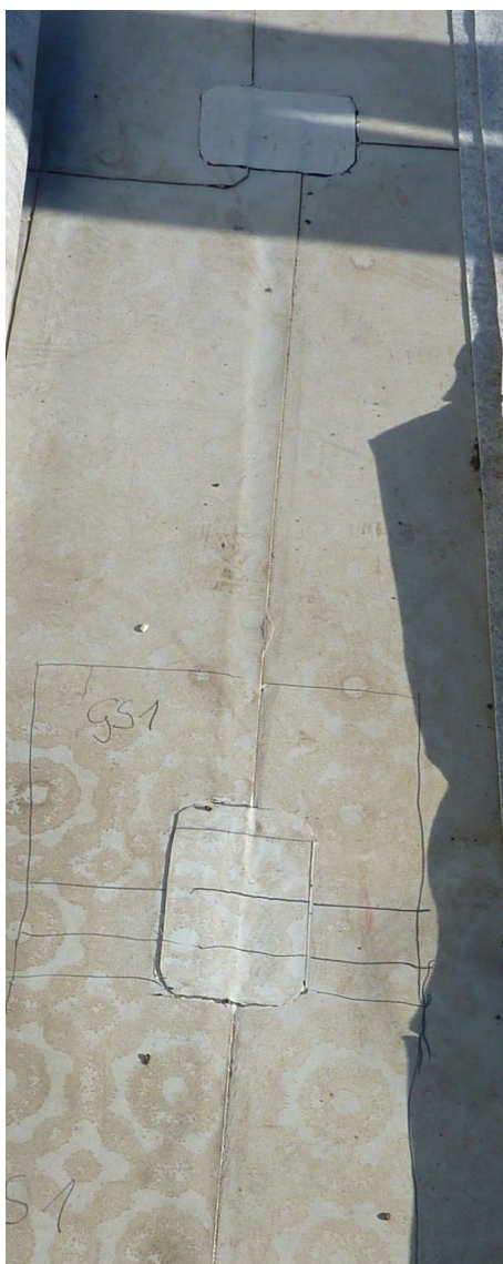
Folienpflaster über gefundenen Fehlstellen: Status Quo (momentan dicht).

Liebe Leserinnen und Leser, liebe Mitglieder,