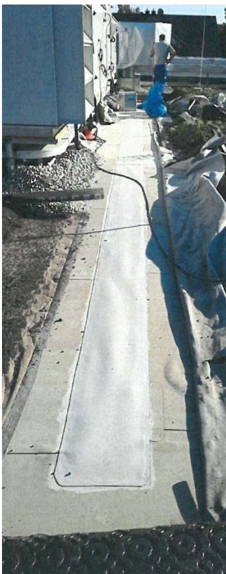
Komplette Überschweißung der “geklebten” Naht, als Nachbesserungsmaßnahme.

Beim oben gezeigten Objekt hat den Auftraggeber nicht der Status quo nach einer Überprüfung mit Impulsstromverfahren interessiert, sondern in erster